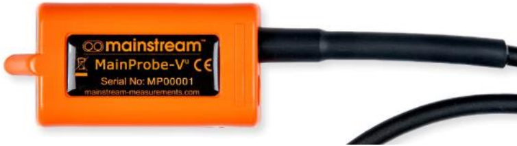
Model : MainProbe-V u