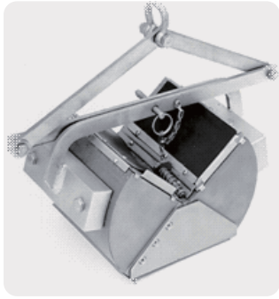
Type : Ponar